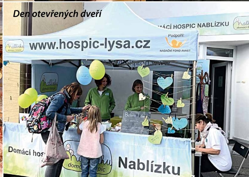
Den otevřených dveří