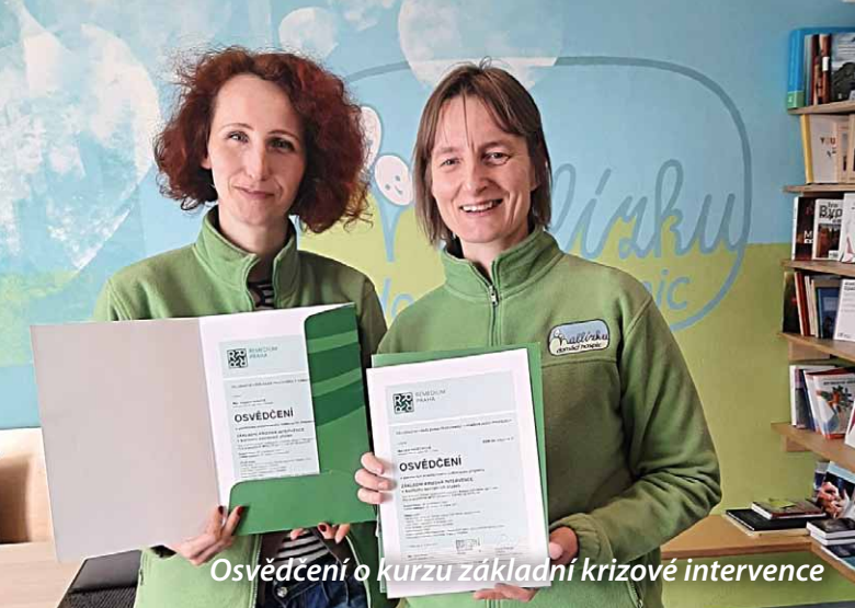
Osvědčení o kurzu základní krizové intervence