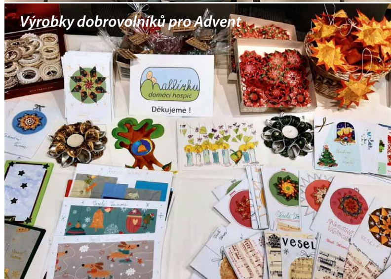
Výrobky dobrovolníků pro Advent