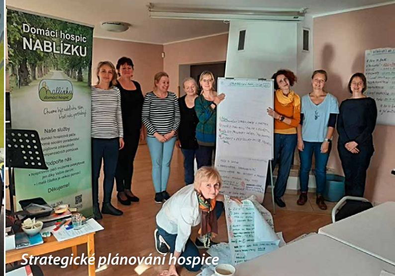
Strategické plánování hospice