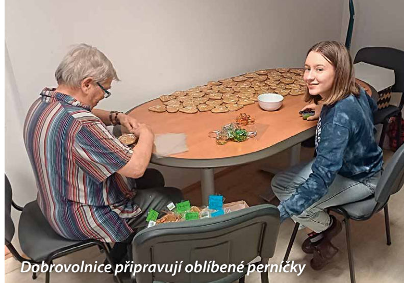
Dobrovolnice připravují oblíbené perníčky