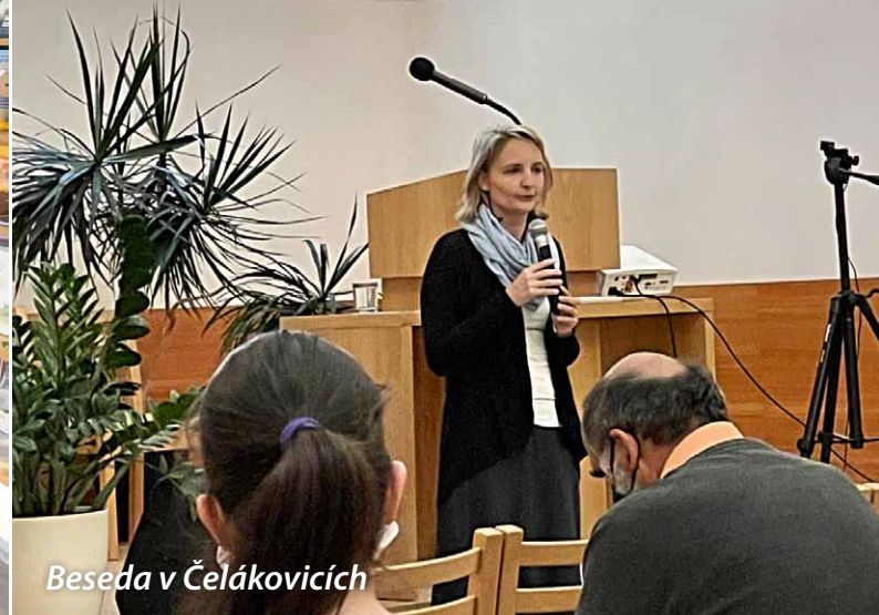
Beseda v Čelákovicích