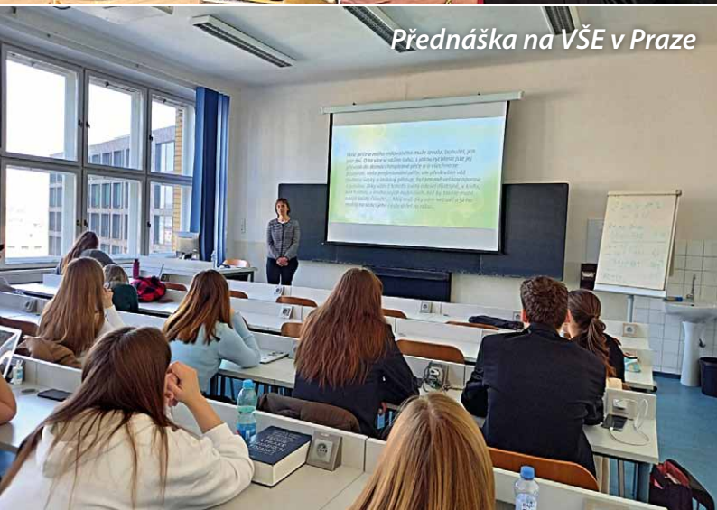
Přednáška na VŠE v Praze