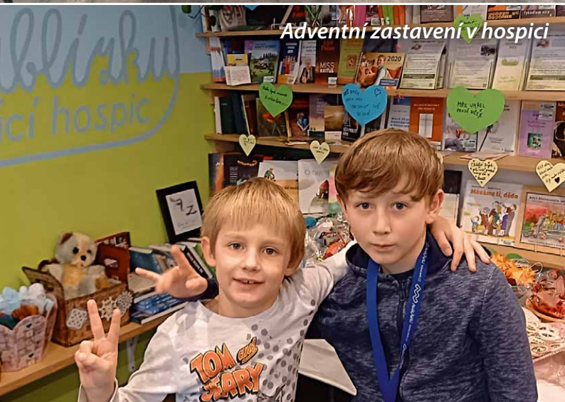
Adventní zastavení v hospici