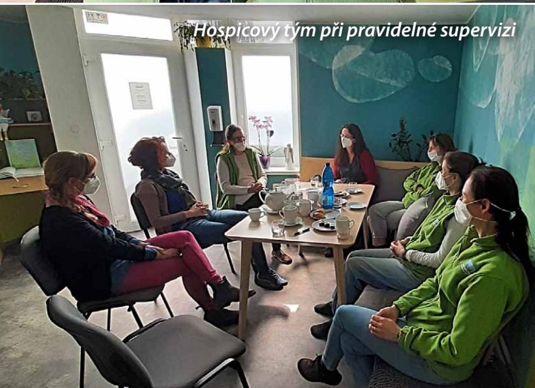
Hospicový tým při pravidelné supervizi