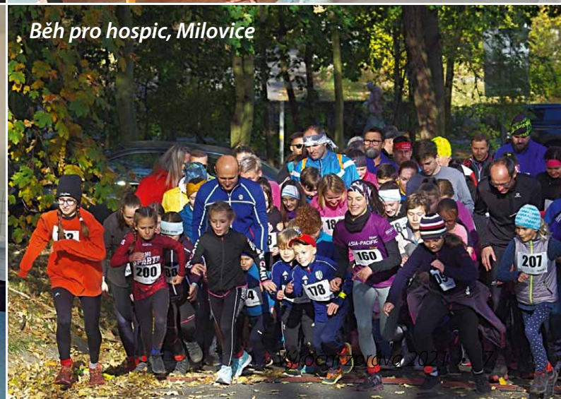
Běh pro hospic, Milovice