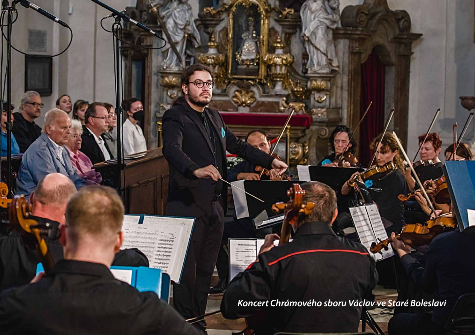
Koncert Chrámového sboru Václav ve Staré Boleslavi